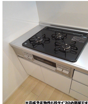
※完成予定物件と同タイプのお部屋です。