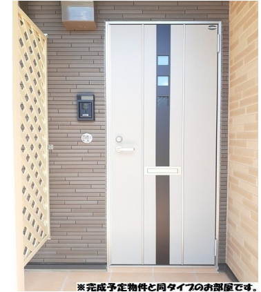
※完成予定物件と同タイプのお部屋です。