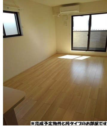
※完成予定物件と同タイプのお部屋です。