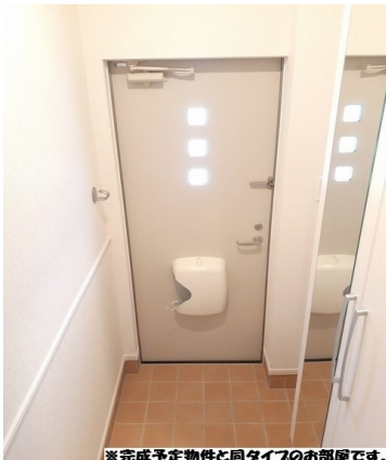
※完成予定物件と同タイプのお部屋です。