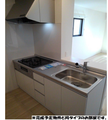
※完成予定物件と同タイプのお部屋です。