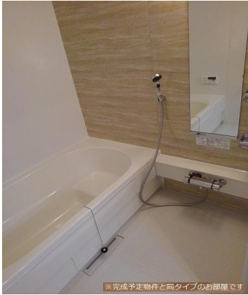
※完成予定物件と同タイプのお部屋です。