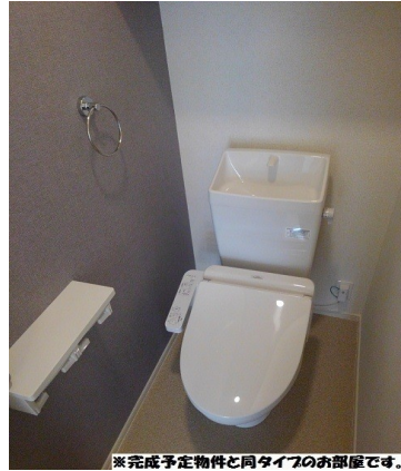
※完成予定物件と同タイプのお部屋です。