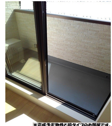
※完成予定物件と同タイプのお部屋です。