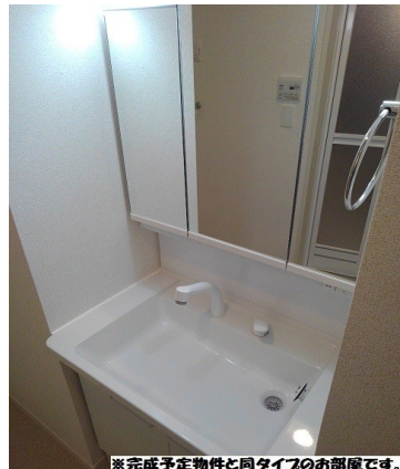
※完成予定物件と同タイプのお部屋です。